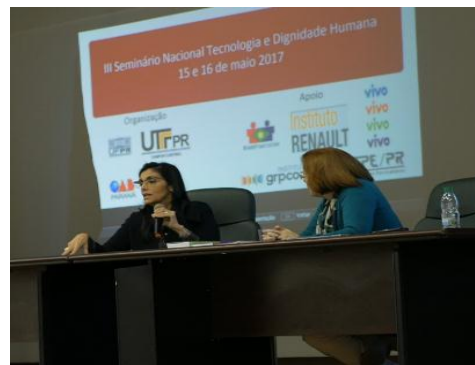
Imagem 05: Alguns Palestrantes do III Seminário Tecnologia e Dignidade Humana - 2017

O III Seminário Nacional de Tecnologia e Dignidade Humana contou com o apoio do Sindicato das Escolas Particulares do Paraná, do Instituto Renault, da Empresa VIVO, do Instituto GRPCOM e da BrazilFoundation.