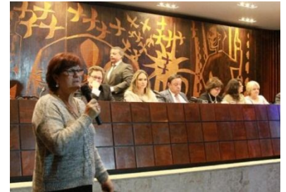
Imagem 06: Palestrantes da III Audiência Pública de Tecnologia e Dignidade Humana – ALEP 2017.