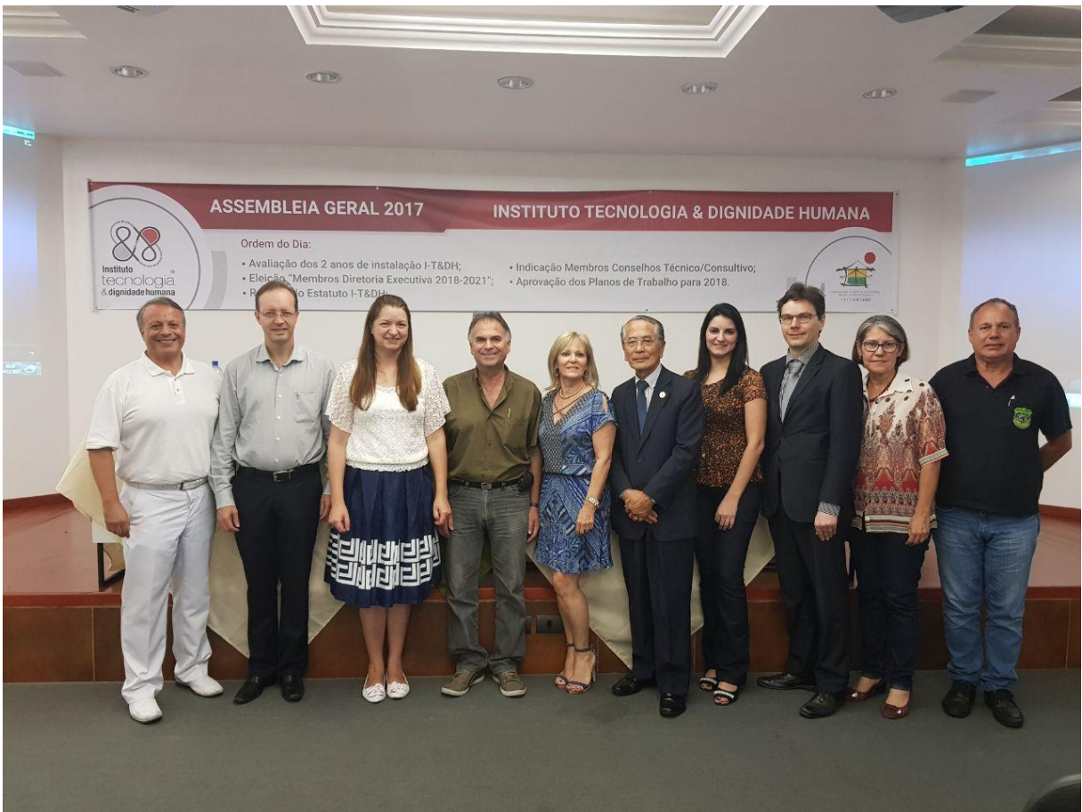
Imagem 07: Assembleia Geral 2017 do Instituto Tecnologia e Dignidade Humana, 14/12/2017.