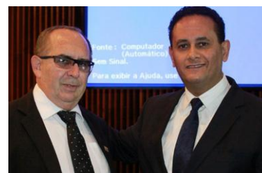
Imagem 03: II Audiência Pública de Tecnologia e Dignidade Humana – ALEP maio 2017.